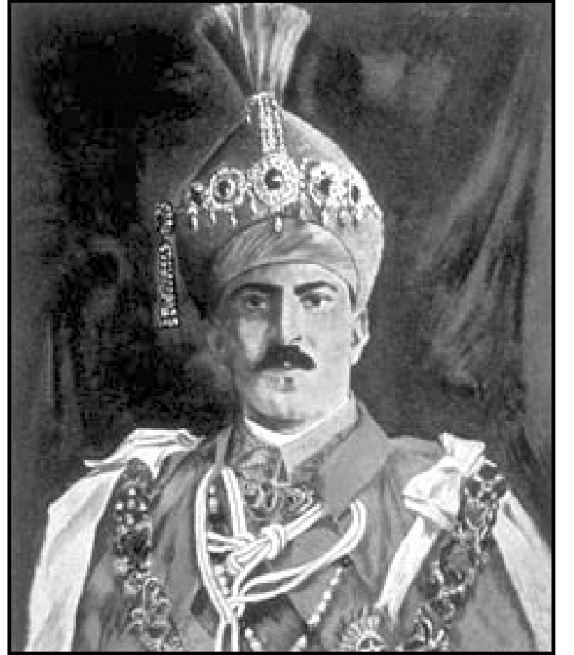
H.E.H. Mir Osman Ali Khan Nizam of Hyderabad